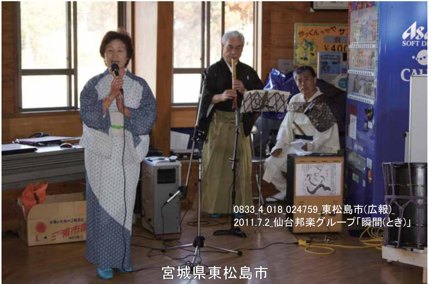
0833_4_018_024759_東松島市(広報) 2011.7.2_仙台邦楽グループ「瞬間(とき)」