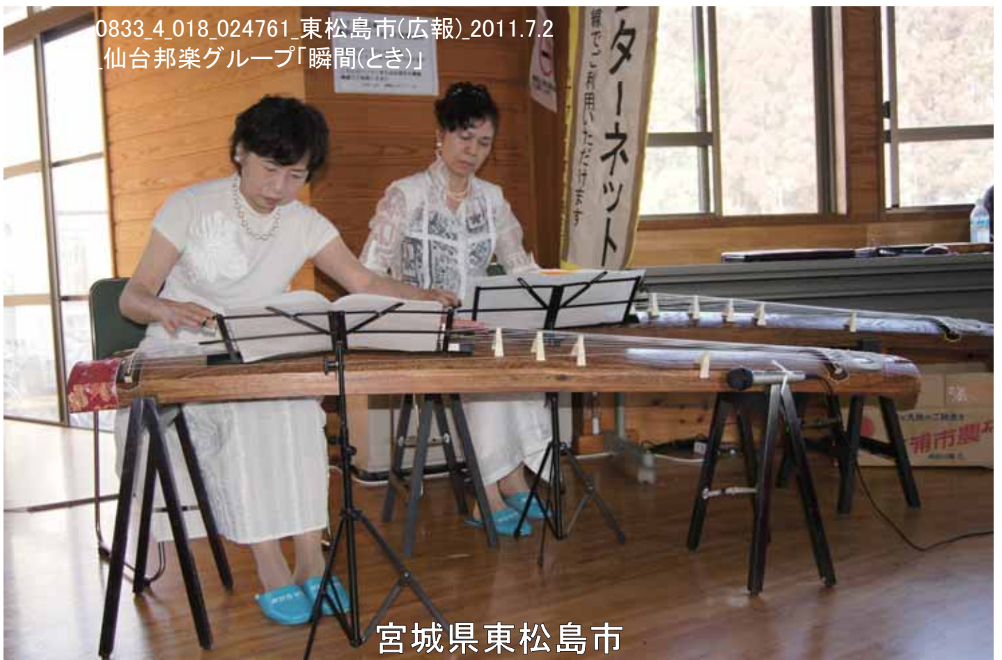
0833_4_018_024761_東松島市(広報)2011.7.2 _仙台邦楽グループ「瞬間(とき)」